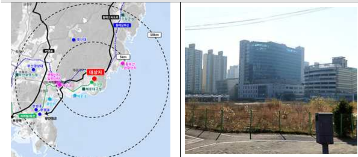
부산좌동 위치도 및 현황사진