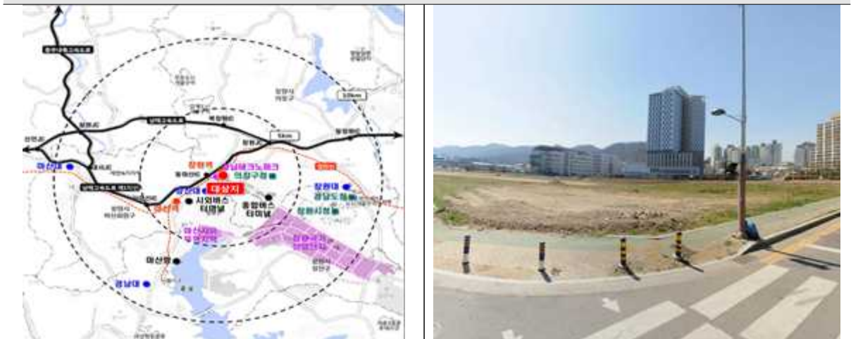
창원경남테크노파크 위치도 및 현황사진