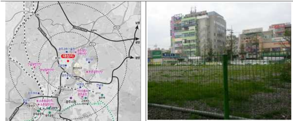
광주첨단 위치도 및 현황사진