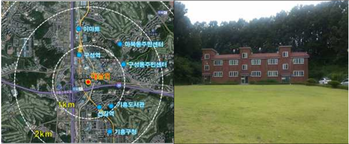
용인 경기여성능력개발본부 위치도 및 현황사진